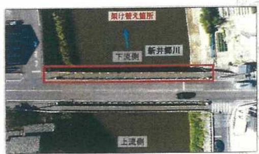
【現状状況 (上空より)】