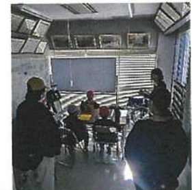
まち探検 濁川連絡所