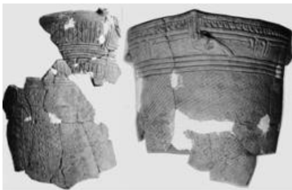
砂崩遺跡縄文式土器

このように，砂丘上や自然堤防，さらにはより低湿地へと進出していく縄文の人々が，どのような生活をしていたのか知りたいことです。遺跡に残る食生活の痕跡や狩猟，漁労の用具などの採集や分析，集落や住居のあとの発見，他地域との交流の確認などが待たれます。