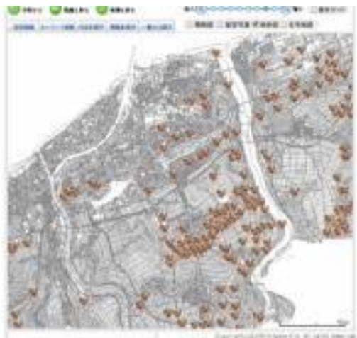
江南区とその周辺の遺跡分布

なお、江南区の遺跡などは、新潟市歴史文化課のHPで詳しく知ることができます。HPからリンクしている「新潟市のガイドマップ」を表示して縮尺を小さくし、「情報を表示」タブをクリックして「歴史に関する施設」にチェックすると、遺跡の分布が表示され、遺跡の位置部分をクリックすると情報が出ます。