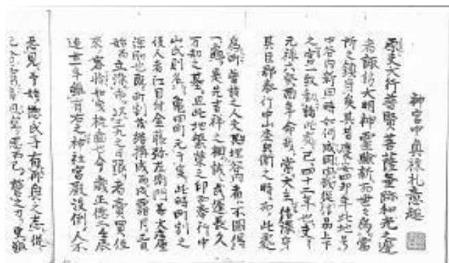
正徳3年 諏訪社棟札

この話は、亀田町出発の20年後の1713年の諏訪社改築の棟札に書かれ、現在も残されています。