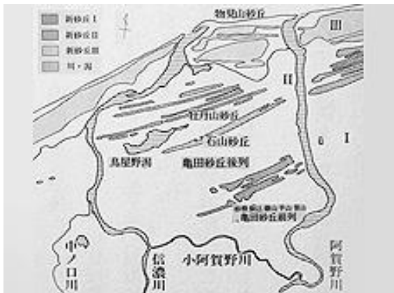
江南区付近の砂丘、河川、河川、潟（「新潟市史I」「横越町史」等より構成）

信濃川も阿賀野川も頻繁に洪水が起きて、人々に被害を与えたのです。そのため、人々の生活には問題が多く、この地域で大きな集落を形成するのは困難だったと考えられます。大きな町や村などができるには、ずっと後の時代まで待つしかありませんでした。