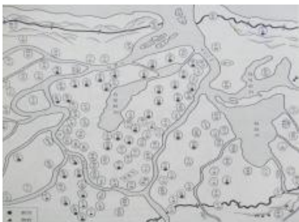
横越嶋図 正保2年（1645年）（「横越町史」より）

拝領時に3,741石だった横越嶋の新発田領は、幕末期には10,063石になるほど新田開発が勧められました。