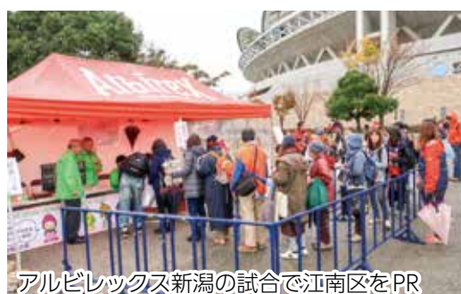
アルビレックス新潟の試合で江南区をPR

今年度は公共交通の勉強会や 空き家問題、休耕地の活用など の土地利用について検討してい きます。