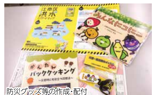
防災グッズ等の作成・配付

今年度は公民館と共催で防災 イベントを開催します。絵本を 活用して助け合いの啓発にも取 り組みます。