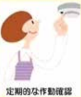
定期的な作動確認

作動確認をしても警報器に反応がなければ、本体の故障か電池切れです。警報器の本体又は電池を交換しましょう。