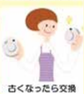
古くなったら交換