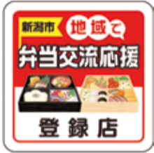
▲登録店はこのステッカーが目印