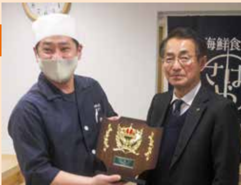
■主食部門 しめ鯖丼 「海鮮食堂 さばや」 江南区北山188 ☎080-3315-0388