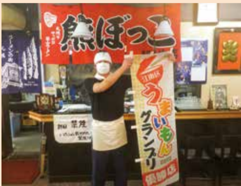
■おかず・おつまみ部門 焼きぎょうざ 「熊ぼっこ亀田駅前店」 江南区東船場4-1-3 ☎025-381-0799