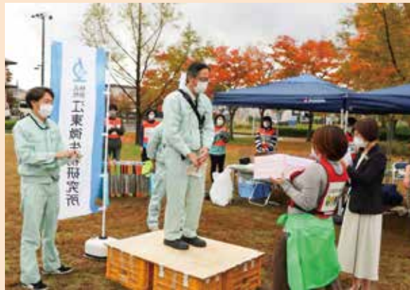
優勝チームに横越地区の名産がつまったスペシャルギフトを贈呈