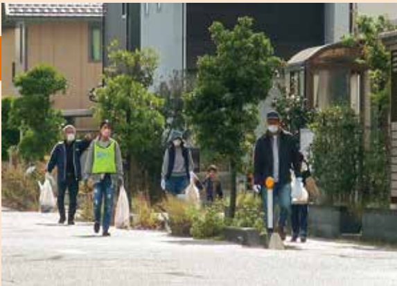
多世代でゴミ拾いを

参加者からは「子どもが楽しみながら参加できた」「よい運動になった」「また参加したい」といった感想をいただきました。