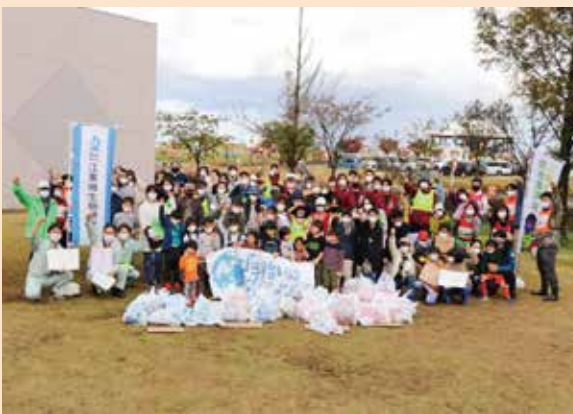
ゴミを回収し、街がキレイに