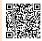
江南区社会福祉協議会ホームページ

江南区社会福祉協議会ホームページに記載されている動画配信サイトのURLよりご覧ください。