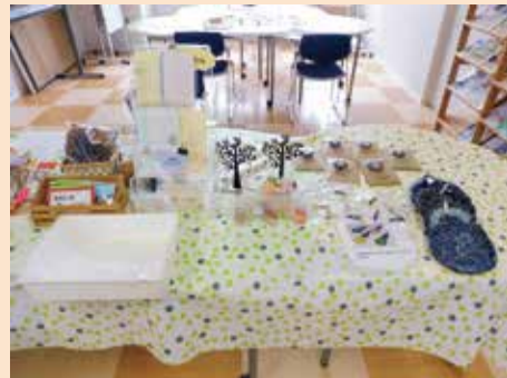
福祉施設製品の展示・販売