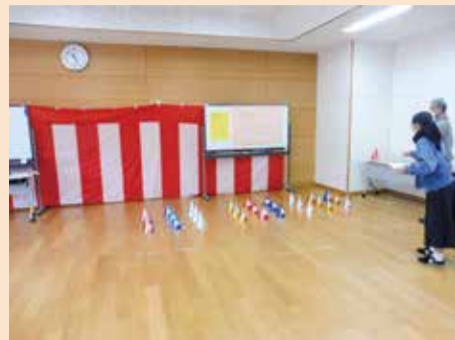
縁日ピラミッド空き缶ボール当て。ゲームを通じ地域の方と交流