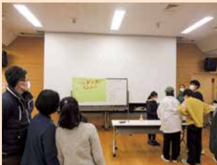
10秒ぴたりチャレンジ。ぴたりで止める子ども