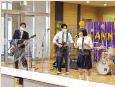
音楽ステージの様子

また、イベントブースでは、亀田西中学校区コミュニティ協議会と亀田西中学校の生徒会が企画した縁日や、福祉団体によるフリーマーケットなどが催され、子どもたちや地域の人たちが交流し、楽しく過ごせる機会となりました。