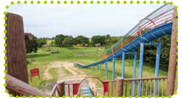
おおえやまこうえん 大江山公園 (笹山423番地)