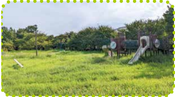
まいひらこうえん 舞平公園 (平賀234番地1)