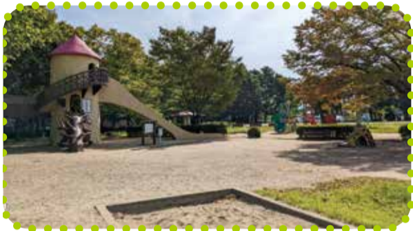
かめだこうえん 亀田公園 (亀田向陽4丁目1779番地1)