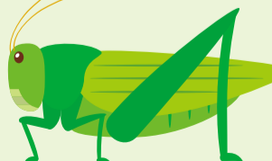
▲キリギリス スーチョンと鳴く。 鳴くのはオスだけ