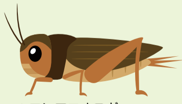
▲エンマコオロギ コロコロリと鳴く。鳴くのはオスだけ