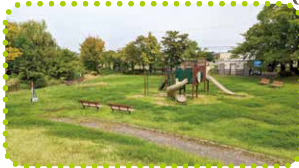
きたやまいけこうえん 北山池公園 (北山183番地1)