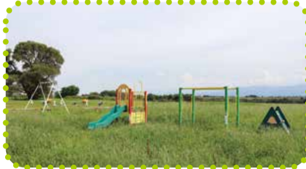
あがのがわ 阿賀野川フラワーライン