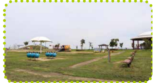
よこごし公園 横越字新田郷5239番地