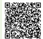
かんたん申し込み

※保育希望の場合は20日(日)までに「かんたん申し込み」より 問 健康福祉課地域福祉担当 ☎025-382-4346