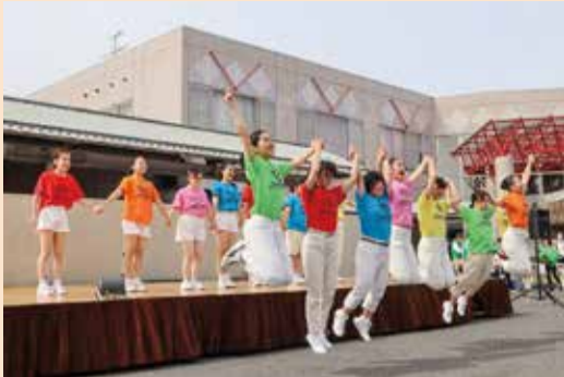
こうなんふれ愛まつりオープニングセレモニー

今回のイベントを通じて、共に支え合い一人ひとりが生き生きとした人生を送ることができる「地域福祉」について考える良い機会となりました。