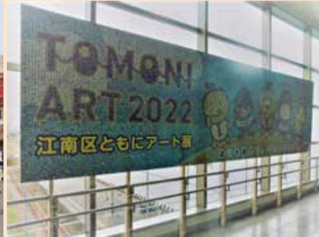
ともにアート展のモザイクアート