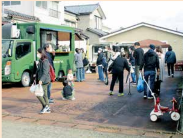
亀田三・九マルシェの様子

11月3日に亀田三・九マルシェが開催されました。本町と東本町の間の通称「市場通り」に沿って、普段の出店者に加え、キッチンカーや若手農家の野菜など多くのお店が出店しました。遠くに足を運ばなければ食べることができない料理や、新鮮な野菜などを目当てに、多くの老若男女が訪れていました。お店の人とお客さんのやり取りが、市場を飛び交い、普段より一層明るく賑わっていました。