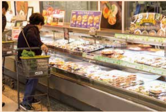
買い物の様子。自分の目で買い物ができる楽しかったとの感想も。