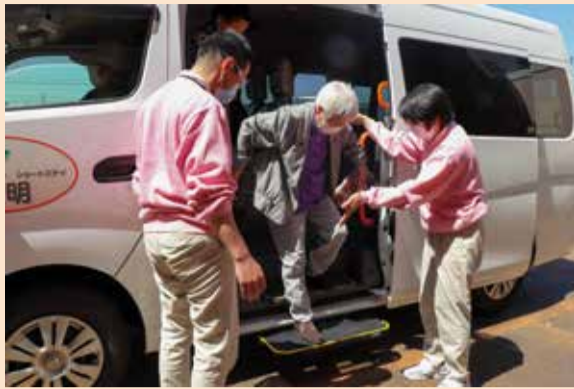
株式会社東日本福祉経営サービスの地域貢献の一環として車両の運転やガソリン代などを負担いただきました

今後、体験乗車会の実施結果を踏まえ、関係者と意見交換を重ねながら、定期運行に向け、検討していきます。