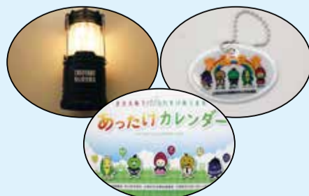
防犯防災グッズと助け合いカレンダー

また、地域で行われている助け合い活動を知ってもらうとともに、自分でもできることから始めてもらうきっかけづくりのため、区内の助け合い活動の事例を集めたカレンダーを作成し、配布しました。