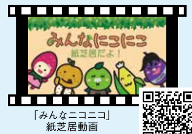
「みんなにこにこ」紙芝居動画