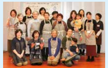
亀田縞エプロン作り