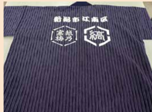
亀田縞で製作した法被