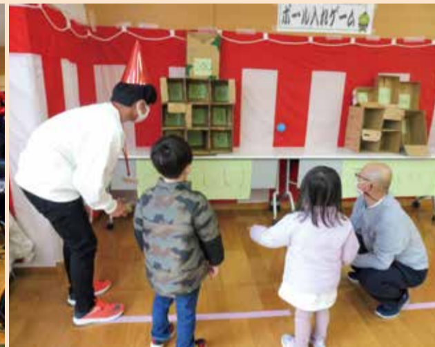
縁日コーナー(ボール入れゲーム)