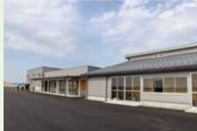
防災ステーションが、ついに完成!