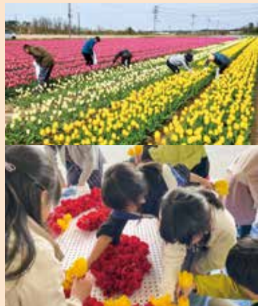
上:晴天の下でチューリップ摘み 下:小学生による花絵づくり