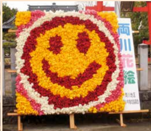
スマイルの花絵が完成!