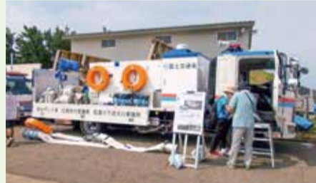
はたらく車の展示もあります。