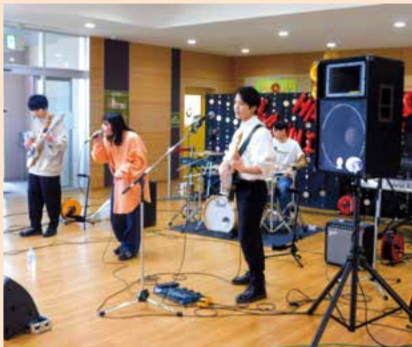
学生バンドの熱い演奏

また、イベントブースには、亀田西中学校の生徒とコミュニティ協議会が協力して企画した縁日コーナーなどがあり、子どもたちや地域の方々楽しく交流していました。