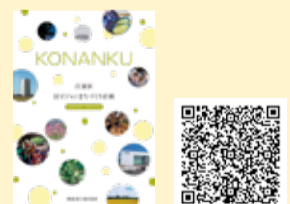
区ビジョンまちづくり計画