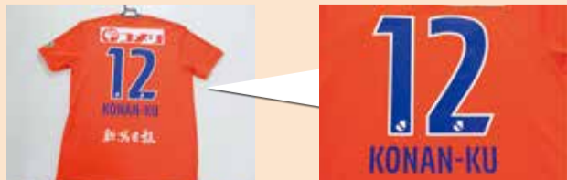
ユニフォームの背中には、KONAN-KUの文字