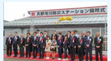
テープカット後の記念撮影