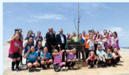
キッズダンスグループ(ハッピービーンズ)による記念植樹

また、一般参加者向けに防災啓発イベントを開催し、参加者は、降雨体験や排水ポンプ車の乗車体験のほか、実際の河川災害時の水防団の活動について疑似体験しました。