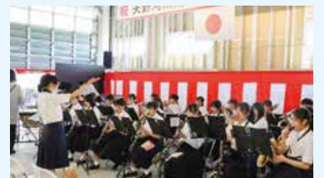
曾野木中学校吹奏楽部の演奏