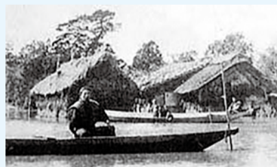
湖のようになった村

大正6(1917)年、曾川水門で補修工事を行っていた場所から堤防が決壊し、亀田郷一帯が泥の海と化しました。決壊地点の復旧には50日以上もかかり、農作物に甚大な被害が及ぶなど、約5万人の住民が水害に苦しんだといわれています。