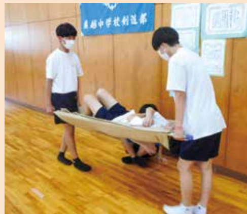
応急担架、運搬方法