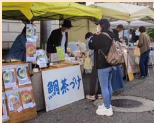
肌寒い日に温かい鯛茶づけが染みみます

遠くに足を運ばなければ食べることができない料理や、新鮮な野菜などを目当てに、多くの親子連れやカップルなどが訪れていました。お店の方とお客さんのやり取りが市場を歩き交い、会場は普段より一層明るい声で賑わっていました。