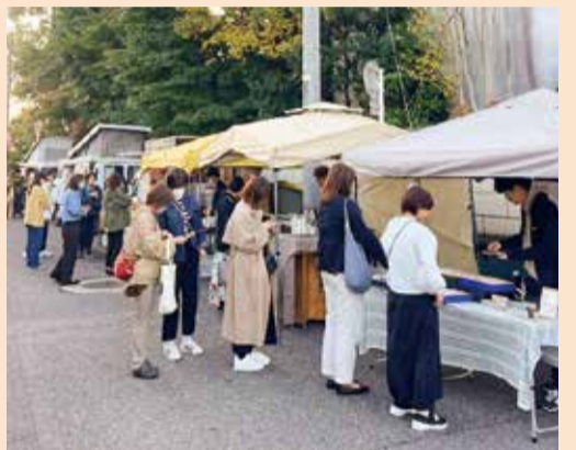
朝から多くの方が訪れていました