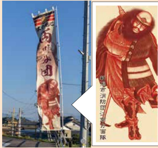
鍾馗をモチーフにしたのぼり旗

消防団は、地域における消防防災のリーダーとして、平常時・非常時を問わずその地域に密着し、住民の安心と安全を守るという重要な役割を担っています。江南区ならではの装いをした鍾馗が、これからの消防団の活躍を見守っていきます。