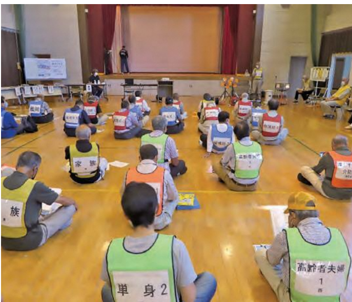
参加者47名はマスク着用。 受付で検温と消毒の後に開会です。