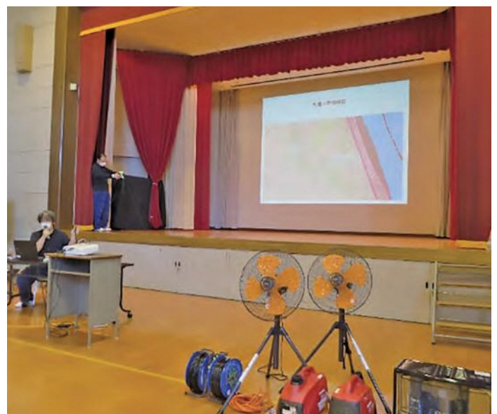
区役所による大雨に備えた行動講習、ハザードマップに確認、避難行動計画の作成を行いました。