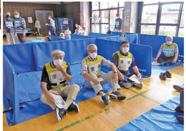
居住スペースへ誘導 (1人あたりは2㎡の体験)