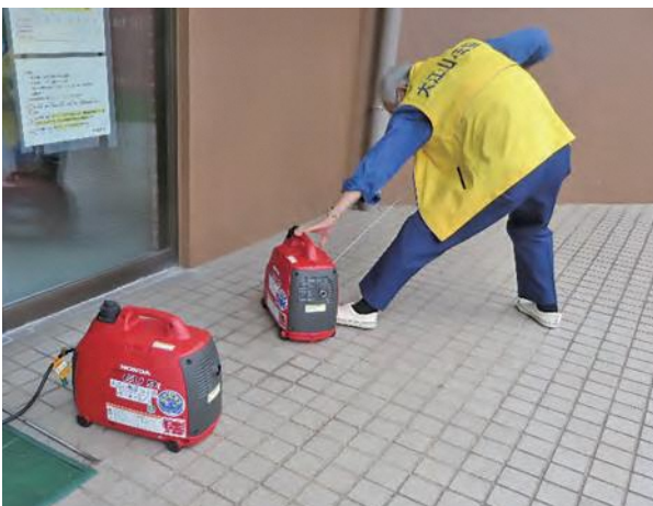
停電を想定し発電機を起動