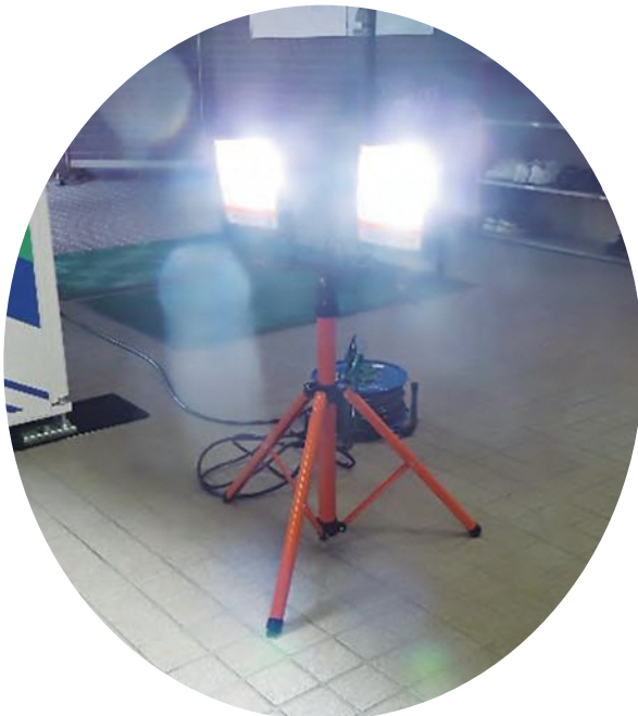
発電機で投光器を点灯