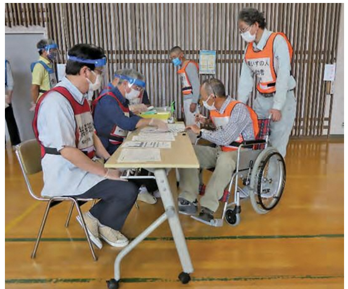
車いすの人と介助者の受付。 避難者の検温発熱者は別室に案内。