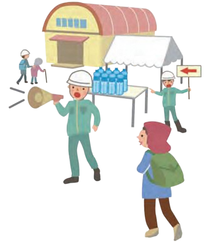
情報掲示板でお知らせ (食料・水の配布、携帯電話の充電場所など)