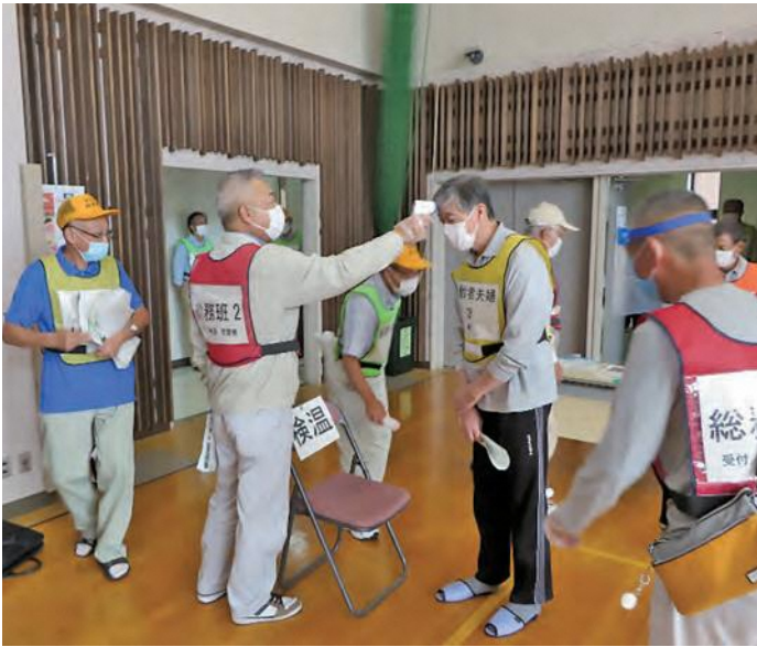
今回は新型コロナウイルス感染症対策を踏まえ、避難所の開設と避難者の体験訓練です。

……降り続く降雨によって阿賀野川の水位が上昇し、万願寺左岸で氾濫危険水位を超えたため、大江山地区に避難指示が発令された。