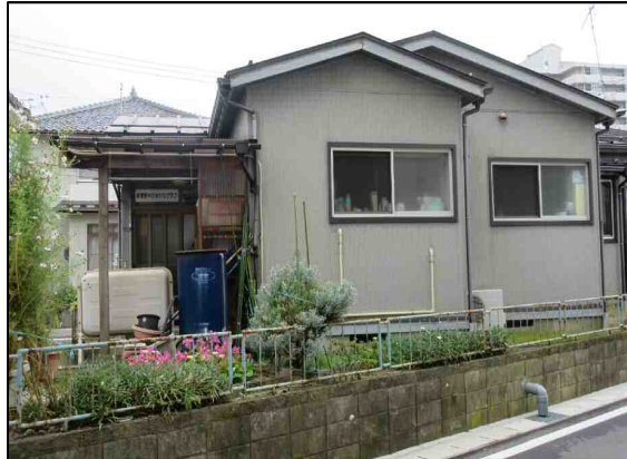
東曾野木ひまわりクラブ