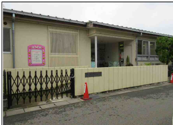
第二曾野木保育園