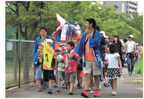
手作りおみこしのねり歩き

その中でも、「東青山ふれあい祭り」は、子ども、保護者、地域の方々と一緒に作る手作りのお祭りで、今年で12回目を迎えます。手作りのおみこしが町内をねり歩き、グラウンドではやぐらを中心にいろいろな出店が出ます。転出入の多い地区なので、転校・卒業しても心に残るお祭りになることを目指しています。