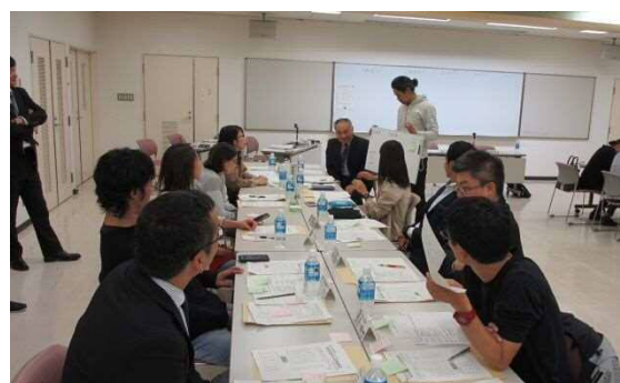
▲開校準備委員会での話し合いの様子

11月の教育委員会定例会では、委員から、「子どもたちが、自分たちの通う学校がなぜこの名前になったのか聞かれた時、明確に子どもたちが理解して、それを誇りに思えるような理由があった方がよい。それを考えたときに、『新通つばさ小学校』という名前が、大きく羽ばたけるような意味合いを込めてつけられたと伝えられたらいい」という発言があり、他の委員からの賛同を集めました。その協議の結果、分離新設校名の候補案は満場一致で「新通つばさ小学校」に決定しました。