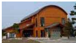
※にししろね保育園の隣です。