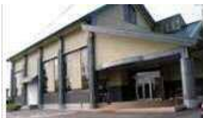
※やすらぎの森公園の隣です。