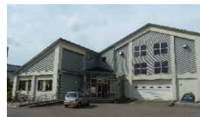
※味方郵便局の隣です。