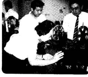
16ミリ映写機操作認定講習会