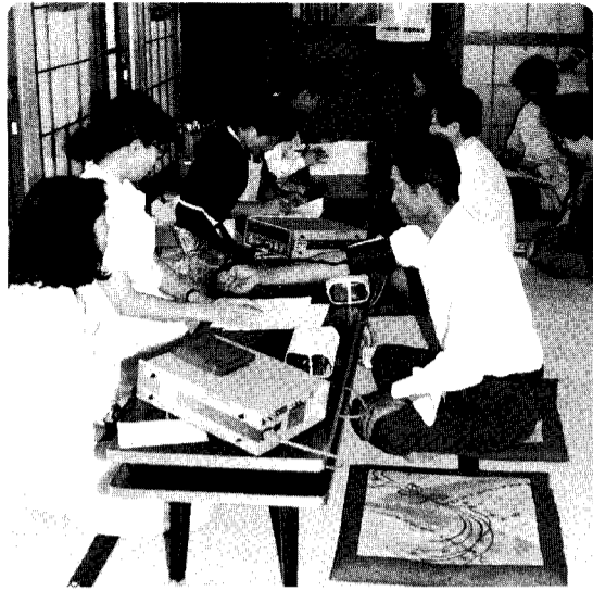
自信はあるけどみんなが持っている不安。年に1度の健康診断を必ず受診しましょう。

「人生八十年」の今日、高齢化に伴って高血圧や糖尿病といった成人病が増えています。小須戸町でも毎年六月に実施している基本健診の結果、数多くの成人病が発見されています。そこで今回は今年の血液検査の結果から、小須戸町の健康状況を考えてみたいと思います。