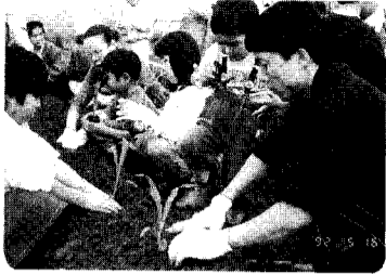
親子チャレンジ教室「畑づくり」

小学生とその両親を対象にした教室です。毎月内容が変わり、キャンプや畑づくり、スキー、Xmasパーティーなど様々な活動を通しての団体活動、親子のふれあいを高めています。