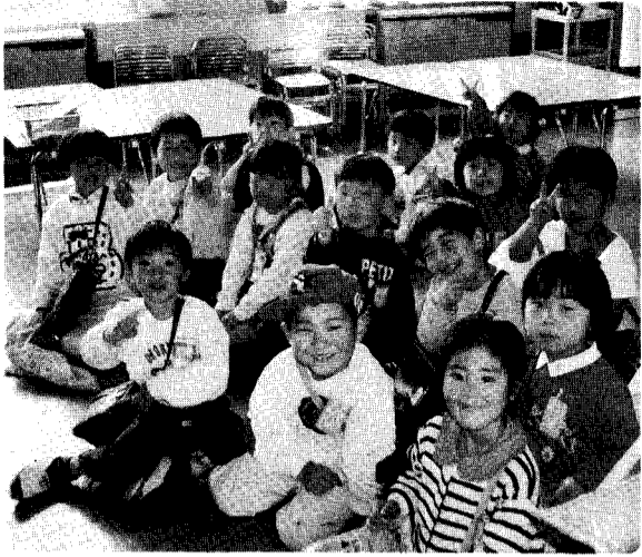
この笑顔 まさに「家庭の鏡」