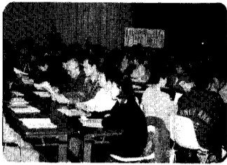
23日 文化協会総会 参加者数132名の皆さんから平成6、7年度の事業等を審議していただきました。