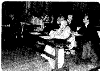
1日 生涯学習講演会 生涯学習とは? 真剣にお話しを聞いて、これからの生涯学習に大変参考になりました。