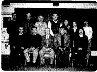
油彩教室のみなさん