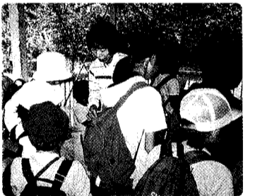
「縦割り遠足」ウォークラリーのゴールした様子

Q 小須戸小学校では、今年度より「チャレンジ21」という新しい教育活動が始まると聞きましたが。 A そのとおりです。矢代田小学校は、平成11年度から、小須戸中学校も、平成12年度から始まる教育活動です。 Q どういう趣旨の教育活動なのか。 A マスコミの報道で「存じのように、学校では「いじめ、不登校、非行等」さまざまな問題が発生しており、憂慮すべき状況にあります。このような時こそ、魅力ある学校づくりをしなければならないのです。 Q この「チャレンジ21」でどのような子どもたちを育てようか。 A 今までの「いきいきスクール・トップアップ運動」ということで3年間、「ふれあい学」が豊かな心の育成に取り組みしてきました。また、町では「あいさつ運動」のように心の育成・道徳教育を積極的に展開されてきました。 そこで小須戸小学校の「チャレンジ21」では、小須戸町の自然の中で、友達や地域の人達との交流を通じ、子ども達の心を育むことに焦点を定めた教育活動を展開しようと考えています。 Q この「チャレンジ21」の推進委員に保護者や地域の方が加わったと聞きましたが。 A そのとおりです。従来ですと学校内だけの推進委員会だったのですが、今日の教育問題を解決するためには、学校だけでは限界があります。二十世紀に生きる能力・資質の育成には、保護者、地域住民の方の参加する委員会を組織して、意見や連携した教育活動が必要であるという考えからです。