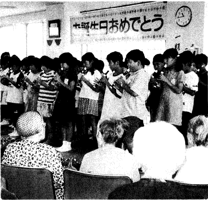
新津市の健進館でボランティア活動 おとしよりの前でリコーダー演奏