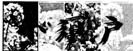
風の中を、刻の中を、ゆったりと歩く。

小須戸町は新潟県のほぼ中央あたりに位置し、信濃川の右岸に面しています。対岸は白根市、東は新潟市、南は田上町と隣接。矢代田駅の東側には雄大な越後山脈が見渡せます。山、田園、信濃川などの自然に恵まれた、のどかで豊かな町です。昔から花木や盆栽の栽培が盛んで、とくにボケについては、全国第一位の栽培産地となっています。花木や盆栽は関東および東北方面をはじめ全国に出荷され、「花と緑の小須戸」として広く知られています。