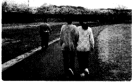
親水緑地公園(河川敷公園)