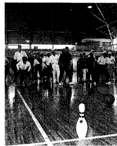
高齢者スポーツ大会

第二十五回小須戸町高齢者スポーツ大会結果 七月九日(日)町民体育館において開催されました。