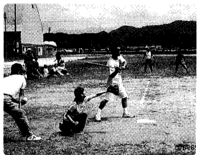
小須戸分館ソフトボール大会

第二十五回小須戸町高齢者スポーツ大会結果 七月九日(日)町民体育館において開催されました。