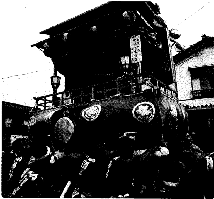
小須戸の伝統・文化の一つ (小須戸喧嘩祭)