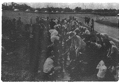
花植えボランティア、スポ少のみんな大奮闘