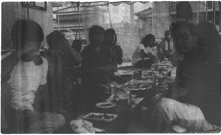
食べて、飲んで、話がはずむ ～親睦会で深まる、まごころのお付き合い～