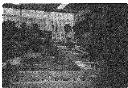
子ども用新刊図書の選定

ありがとうございました。そして、これからもよろしく願います。カメラが見た、奉仕活動を紹介します。