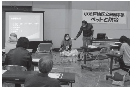
↑昨年の講座の様子

申込方法 6月15日(水)～7月1日(金)までに小須戸地区公民館 TEL0250-25-5715に電話で申し込んでください。