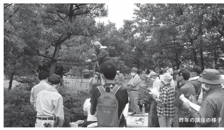
昨年の講座の様子