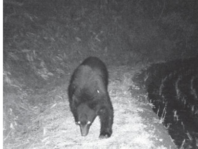
昨年5月に金津地区で撮影されたクマの画像