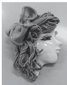
講師作品(ブローチ)