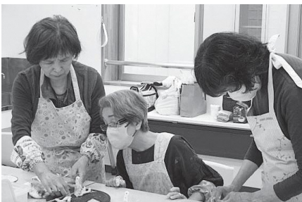
取材当日の活動の様子