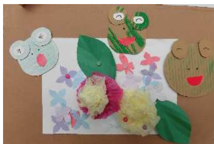
ネクサス・わかば利用者の方の作品

応募作品は、「横越文芸誌」として11月下旬ごろ発行します。 横越地区公民館にありますので、ご自由にお持ち帰りください。