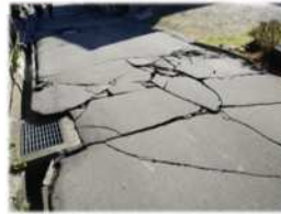
対象となる道路(被害)の例