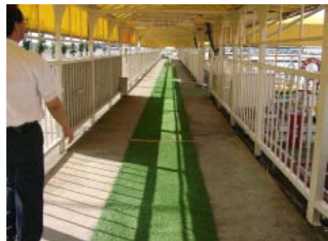
写真5.23 屋外にある乗降場