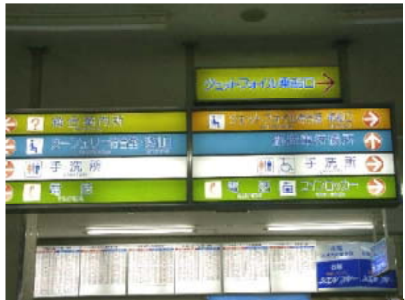
写真5.19 施設内の案内