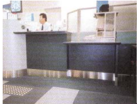
写真5.22 車いすの方に配慮したカウンター