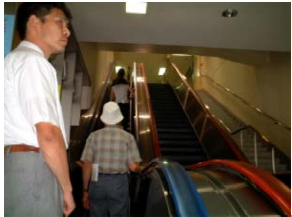
写真5.18 ターミナル出入口