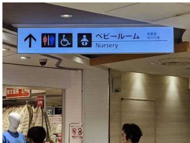
写真 6-1 トイレ・ベビールームの案内