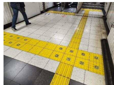
写真 6-4 QRコードで視覚障がい者を誘導