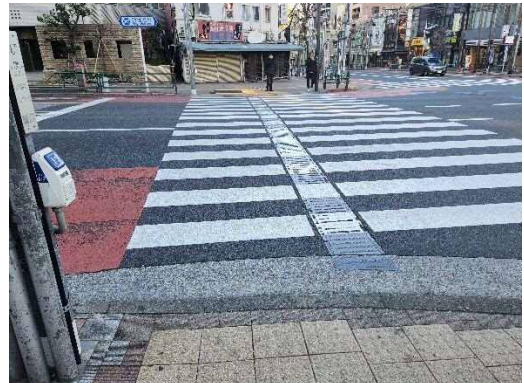
写真 6-6 エスコートゾーン