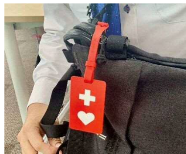
写真 6-8 ヘルプマーク