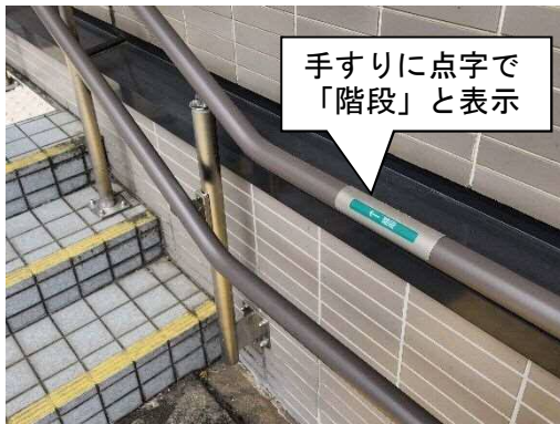
写真 6-5 手すりの案内表示（点字）