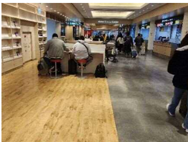
写真 6-3 通路との壁がない施設