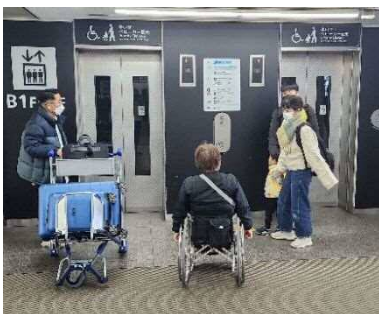
写真 6-7 車椅子利用者への声掛け