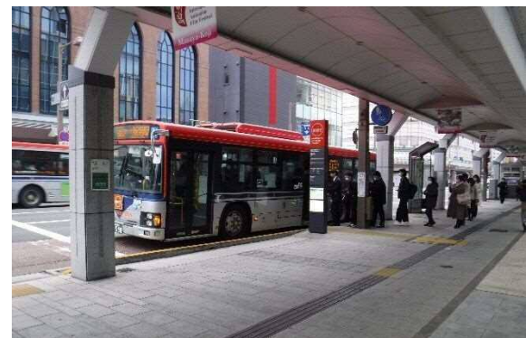
写真 6-38 古町停留所