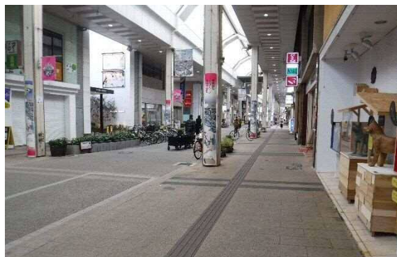
写真 6-39 古町通 6 番町