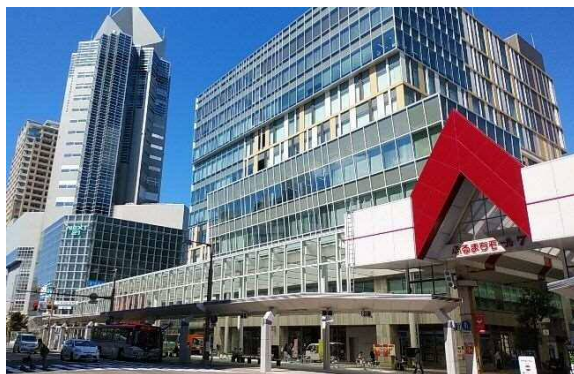
写真 6-37 古町ルフル