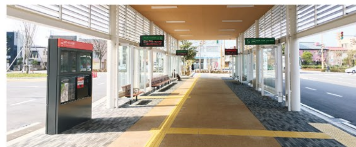
市役所ターミナル 内観

施設内容 上屋 (防風壁付き)、待合所、 トイレ、ベンチ、駐輪場、 情報案内設備 (自立型、突出型)