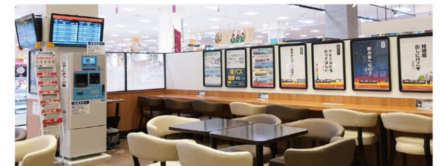
バスインフォメーション内観