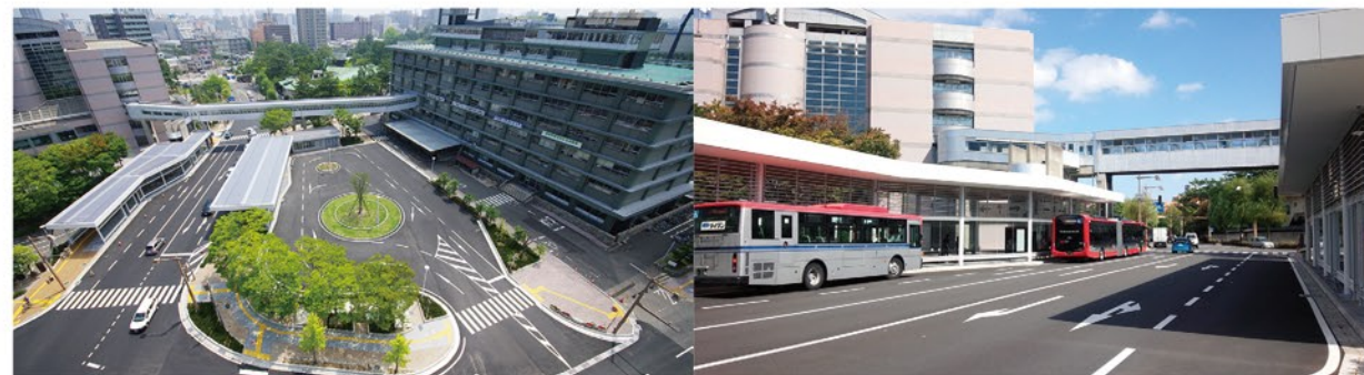
市役所ターミナル 外観