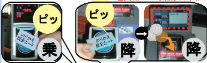
運賃箱上の液晶表示画面