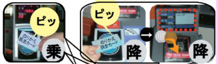
運賃箱上の液晶表示画面