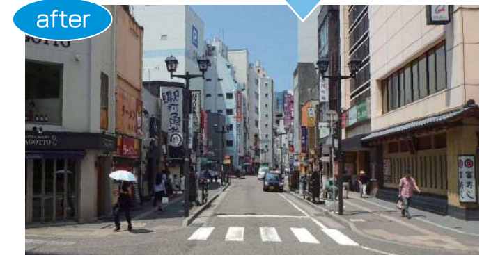
弁天町通(市道南2-49号線)