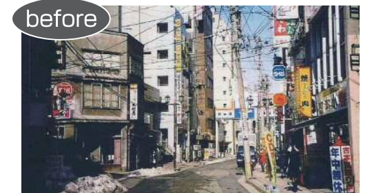
景観を阻害する電柱

安全で快適な通行空間の確保や都市景観の向上、都市災害の防止等を目的として、電線類の地中化を進めています。