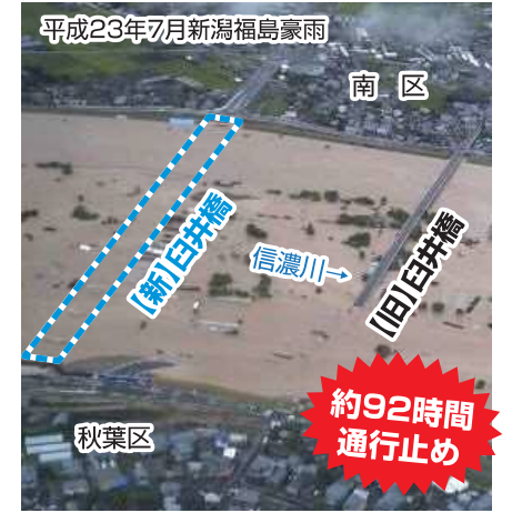
【旧】臼井橋 通行止めの様子