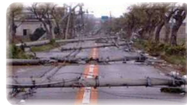
災害で道をふさぐ電柱