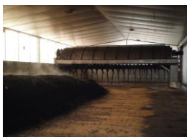
食品廃棄物を肥料に (堆肥化)