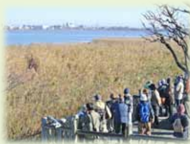
鳥屋野潟市民探鳥会

現在は鳥屋野潟の魅力を知ってもらおうと、さまざまな団体によるイベントが年間をとおして開催されています。