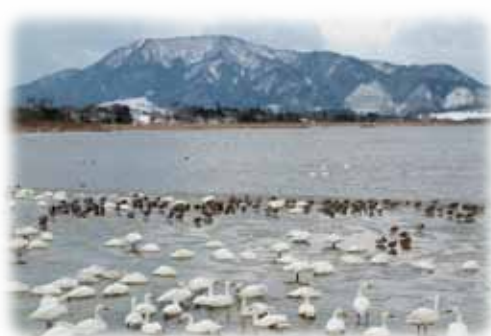
多くのハクチョウが訪れる佐潟

1996年のラムサール条約への登録を踏まえ、2000年に佐潟周辺自然環境保全計画を策定しました。計画では、佐潟の自然環境保全の考え方を具体的に示すほか、里潟という考え方やラムサール条約の精神を基本方針とした内容が盛り込まれています。