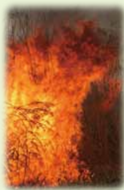
福島潟のヨシ焼き