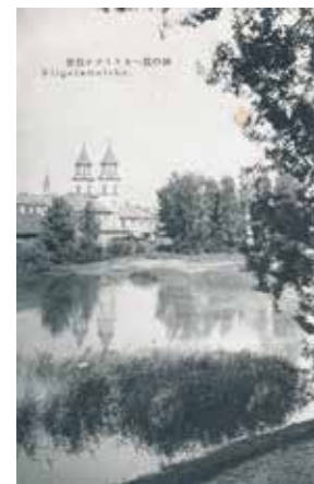
異人池とカトリック教会を描いた絵はがき

当時、どっぺり坂の下には、「異人池」と呼ばれる大きな池がありました。現在は埋め立てられていますが、池の近くにはカトリック新潟教会=写真③=とたくさんのポプラの木があり、その異国情緒漂う景観は多くの市民に親しまれました。