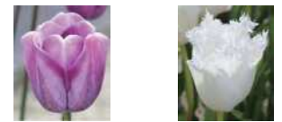
ゆきむらさき 雪紫