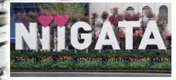
新潟駅前のNIIGATA オブジェも チューリップの植え込みで春らしく。