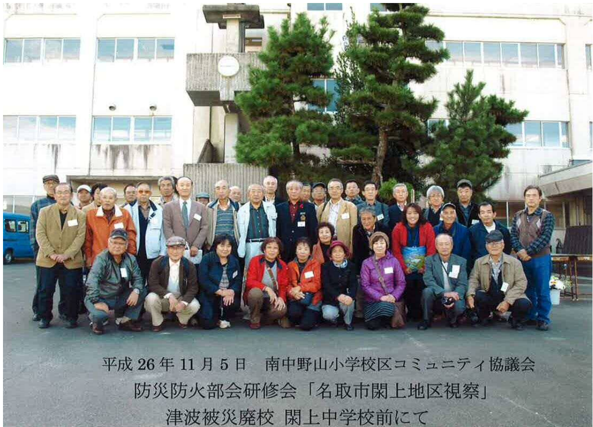
平成 26 年 11 月 5 日 南中野山小学校区コミュニティ協議会 防災防火部会研修会「名取市関上地区視察」 津波被災廃校 関上中学校前にて