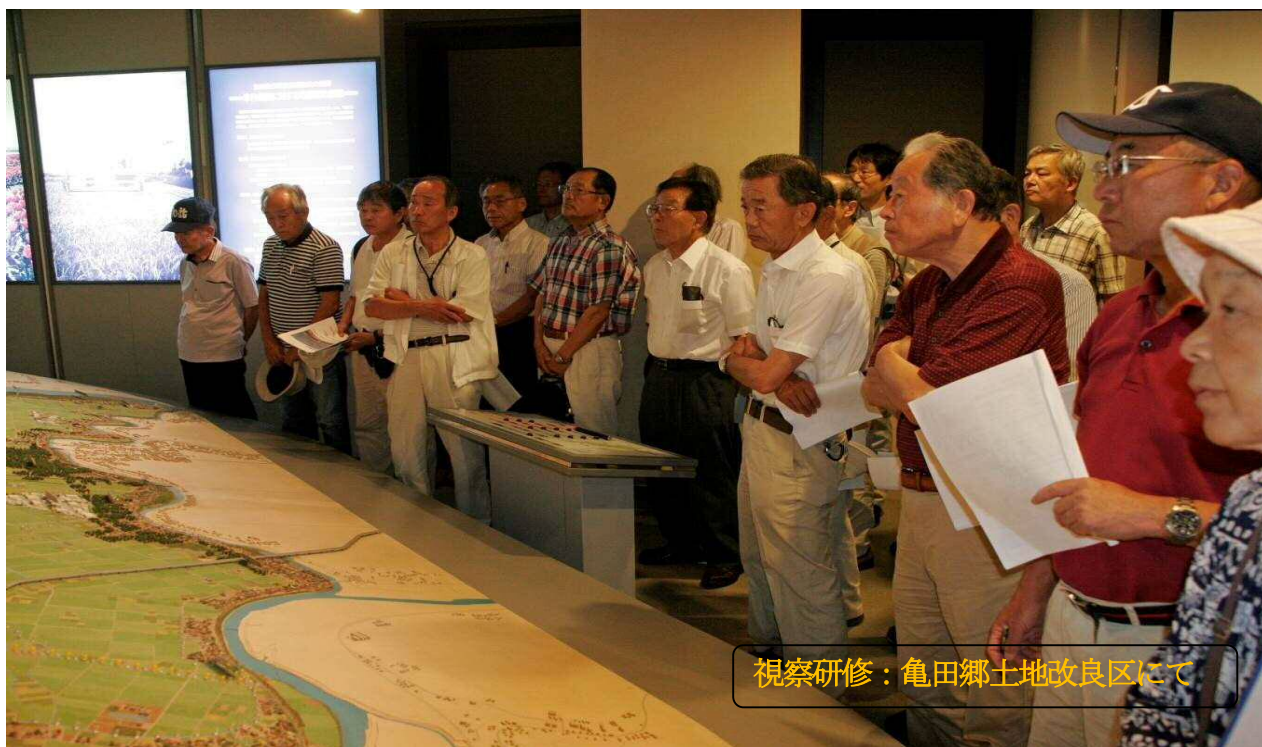
視察研修：亀田郷土地改良区にて