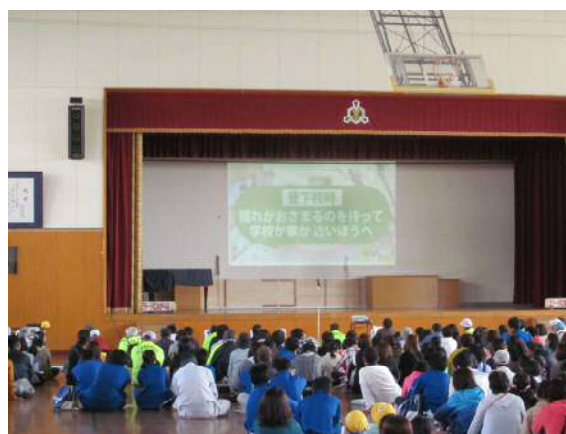
避難所での防災に関する啓発スライドの上映