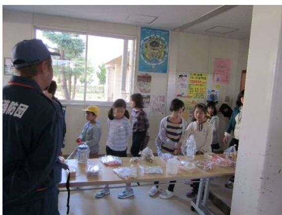
防災グッズの展示