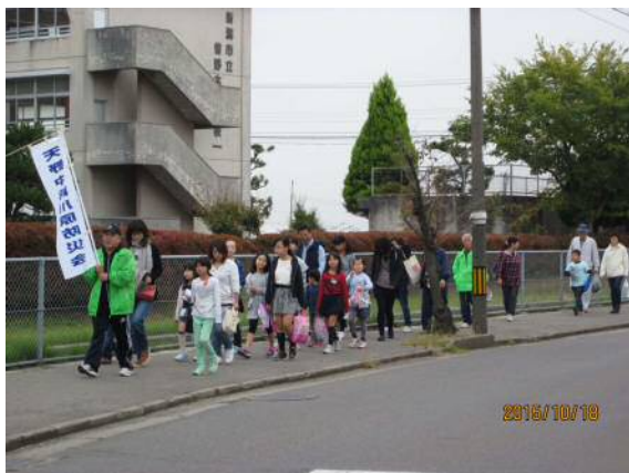
防災会ごとにまとめて避難所までの避難