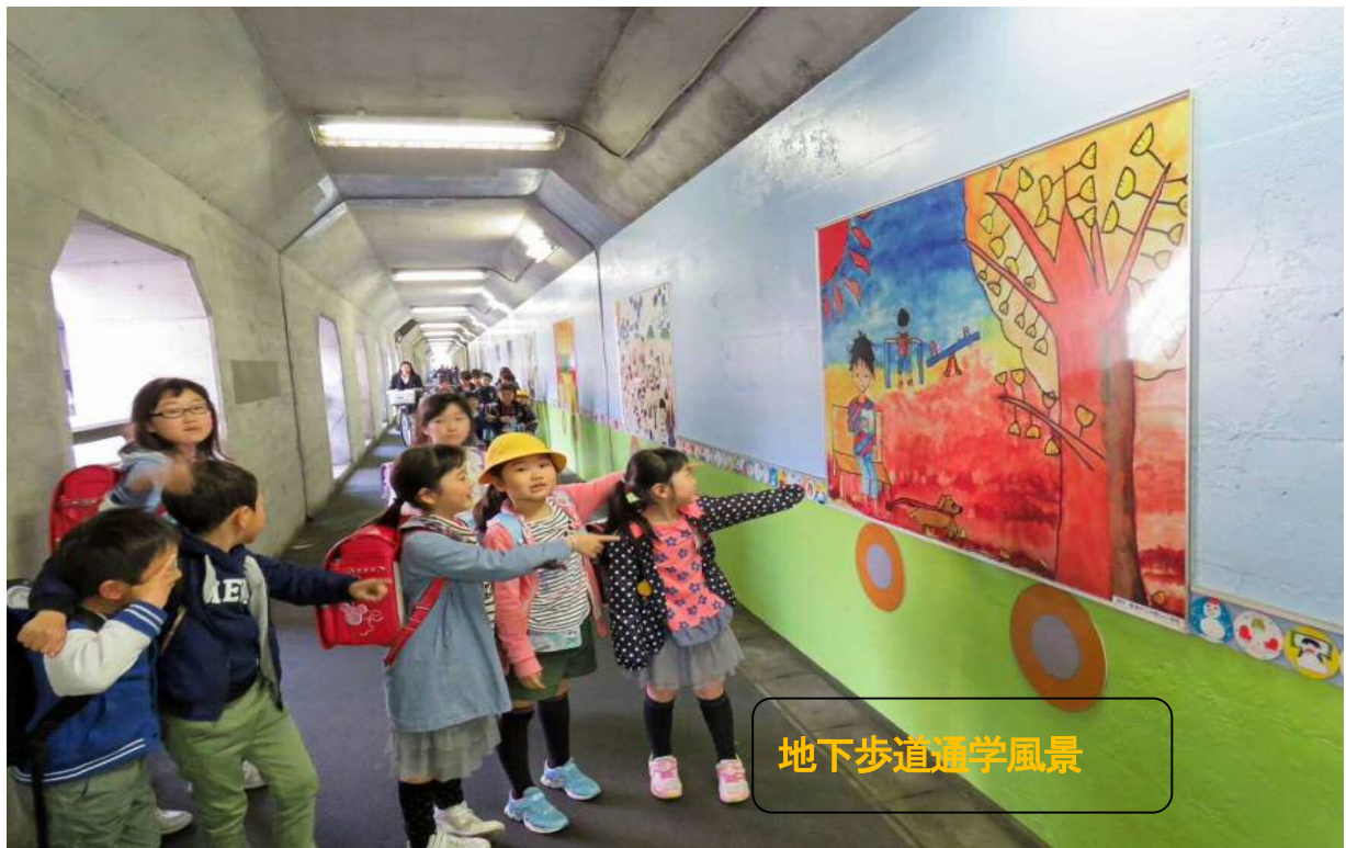
地下歩道通学風景

今後、この通路（西側も含め）のメンテナンスを地域全体でやっていく。児童生徒には、総合学習等で地域を知る機会として利用してもらう。