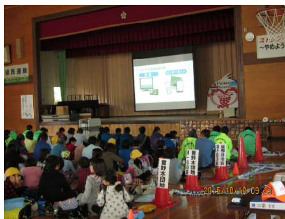
避難所での防災に関する啓発スライドの上映