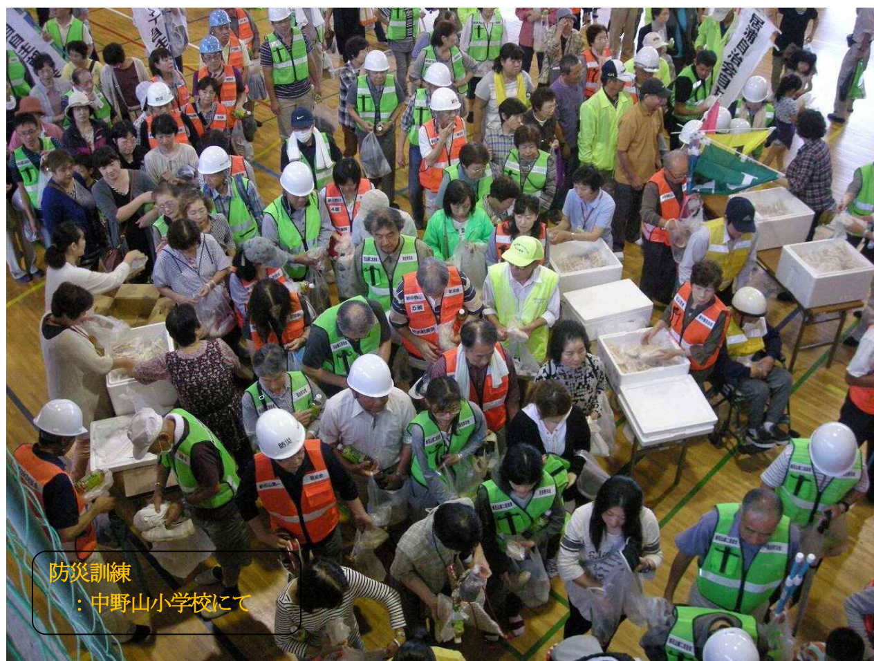
防災訓練 ：中野山小学校にて