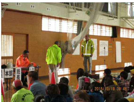
避難所で防災会ごとの点呼