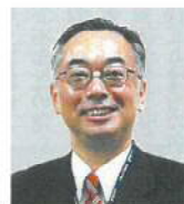
新潟市西区長 眞島 幸平