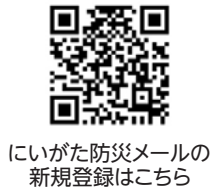
にいがた防災メールの新規登録はこちら

災害の心配があるときは、テレビ、ラジオ、インターネットなどを活用し、気象情報を積極的に確認しましょう。